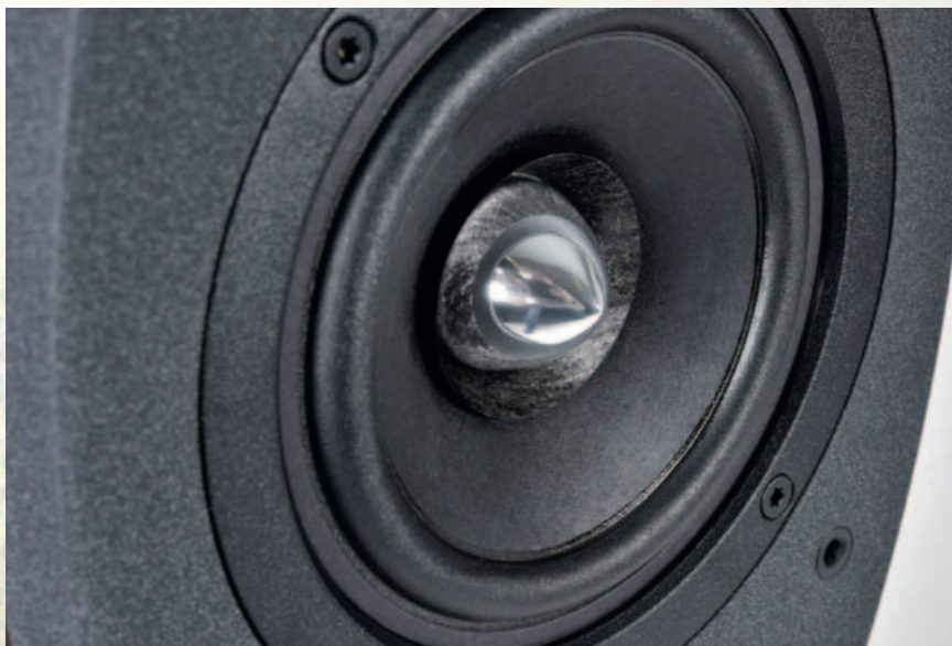
Der Breitbänder bekam für das 8.2-Update einen Feinschliff. Ein Papierring als Schwirrkonus im Zentrum der glasfaserverstärkten Verbundmembran ist für die Höhen zuständig.

Was die Bedienung und Nutzungsmöglichkeiten betrifft, ist die Audium Comp 8.2 Air absolut Mainstream-taug-